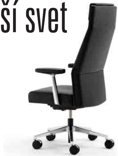
Stolička Siento od firmy Steelcase vyhovuje ľuďom aj prírode.

Ako by vyzerali budovy a výrobky, ak by ich dizajnéri brali do úvahy naozaj všetko – ľudí, zvieratá, prírodu, večnosť? Autori knihy Cradle to Cradle (North Point Press, 2002), architekt William McDonough (USA) a chemik Michael Braungart (DE), už pred desiatimi rokmi vyhlásili koniec konfliktu medzi priemyslom a životným prostredím, ktorý so sebou priniesla priemyselná revolúcia. 21. storočie podľa nich patrí spolupráci s prírodou, ktorá otvára netušené obzory a prináša vynikajúce výsledky.