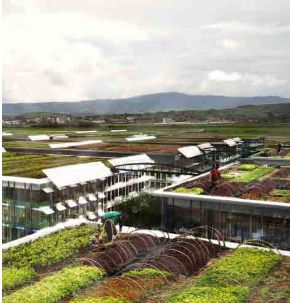
Vizualizácia pestovania na strechách obytných domov podľa W. McDonougha, Liou-čou, Čína.

na globálnu udržateľnosť, McDonough Braungart Design Chemistry (MBDC). MBDC ponúka certifikačný program, ktorý vyhodnocuje dosah produktov na ľudské zdravie a životné prostredie, ako aj ich recyklovateľnosť. Firmy si tiež od MBDC môžu nechať poradiť, ako priblížiť svoje produkty konceptu Cradle to Cradle a optimalizovať ich životný cyklus.