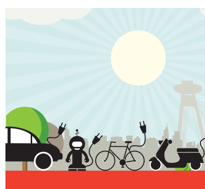
Vizuál ZSE na podporu elektromobility.

Firmy sa do podpory alternatívnej mobility zapojili rôznymi spôsobmi. Spoločnosti Slovnaft, Orange a Slovak Telekom dlhodobo na svojich intranetoch ponúkajú zamestnancom možnosť zdieľať auto do práce a z nej spolu s kolegami. Západoslovenská energetika (ZSE) a Východoslovenská energetika (VSE) sa verejnými podujatiami roz-