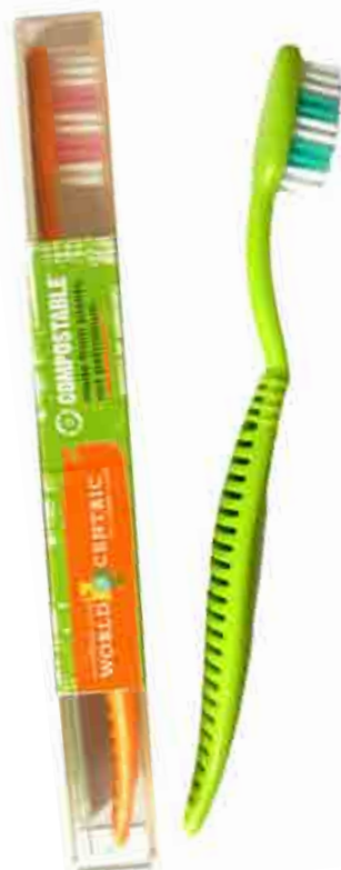
Zubné kefky od World Centric majú rozložiteľné rúčky.

Zubné kefky sú produktom pomerne krátkodobej spotreby, preto ich každoročne vyhodíme až 450 miliónov. Kefky spoločnosti World Centric nahrádzajú štandardné plastové rúčky za rúčky zo stopercentne rastlinných materiálov. Štetinky zatiaľ rozložiteľné nie sú, ale dajú sa odpojiť, takže rúčka sa môže ďalej spracovať. Výrobca intenzívne