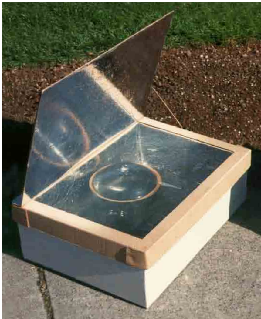
Kyoto Box je na prvý pohľad obyčajná škatuľa, v skutočnosti však zachraňuje životy.