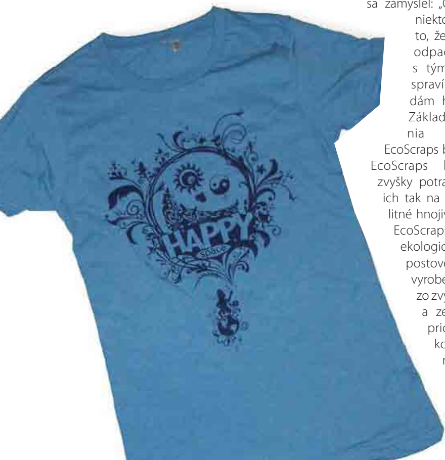
Tričko Happyspace Positivewear.