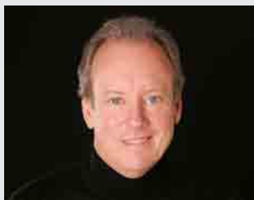
William McDonough je medzinárodne uznávaný „zelený“ architekt a tvorca konceptu Cradle to Cradle.

Architekt William McDonough vytvára budovy, ktoré produkujú viac energie a čistej vody, ako samy spotrebujú. Podieľa sa aj na urbanistickom plánovaní siedmich čínskych miest. Aký je teda recept na stavbu mesta, kde sa každému dobre žije? Prvým krokom je dôsledné preskúmanie hydrológie a možností slnecnej a vetranej energie. Konkrétne plánovanie začína umiestnením parkov a zelených plôch, ktoré budú tvoriť ekologickú infraštruktúru. Pokračuje sa plánom umiestnenia obytných budov, medzi ktoré sa „zamiešajú“ obchodné centrá a zastávky verejnej dopravy tak, aby boli pre každého obyvateľa dostupné do 5 minút chôdze. Nevyhnutnosťou je systém kanalizácie, ktorý je prepojený s výrobou zemného plynu – ten sa vracia naspäť do domácností na využitie v kuchyni. Zvyšky z varenia vytvoria kompost, vďaka ktorému sa bude dariť plodinám a tráve rastúcim na strechách obytných domov. Strechy tovární a priemyselných komplexov zase zachytia solárnu energiu, ktorú mesto využije pre svoj každodenný život.