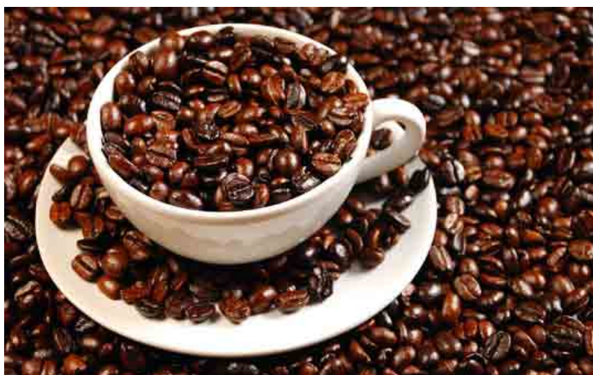
Výrobky Fair Trade v sebe spájajú ekologickú aj sociálnu zodpovednosť.

sa používa a vďaka rozmerom podobným iPodu aj jednoducho prenáša.