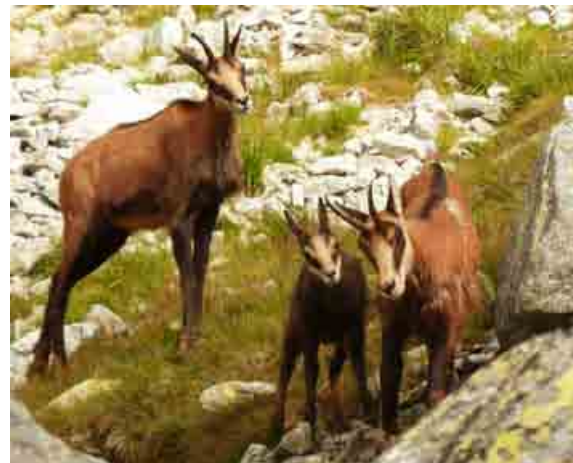
Vítazný projekt prispieva aj k ochrane kamzíka vrchovského tatranského.

Projekt Slovenských elektrární je postavený na dlhoročnom partnerstve so slovenskými národnými parkmi a realizoval sa v súčinnosti so Štátnou ochranou prírody. V spolupráci s TANAP-om napríklad zabezpečil monitoring kamzíka vrchovského tatranského, ako aj dravých vtákov sokola